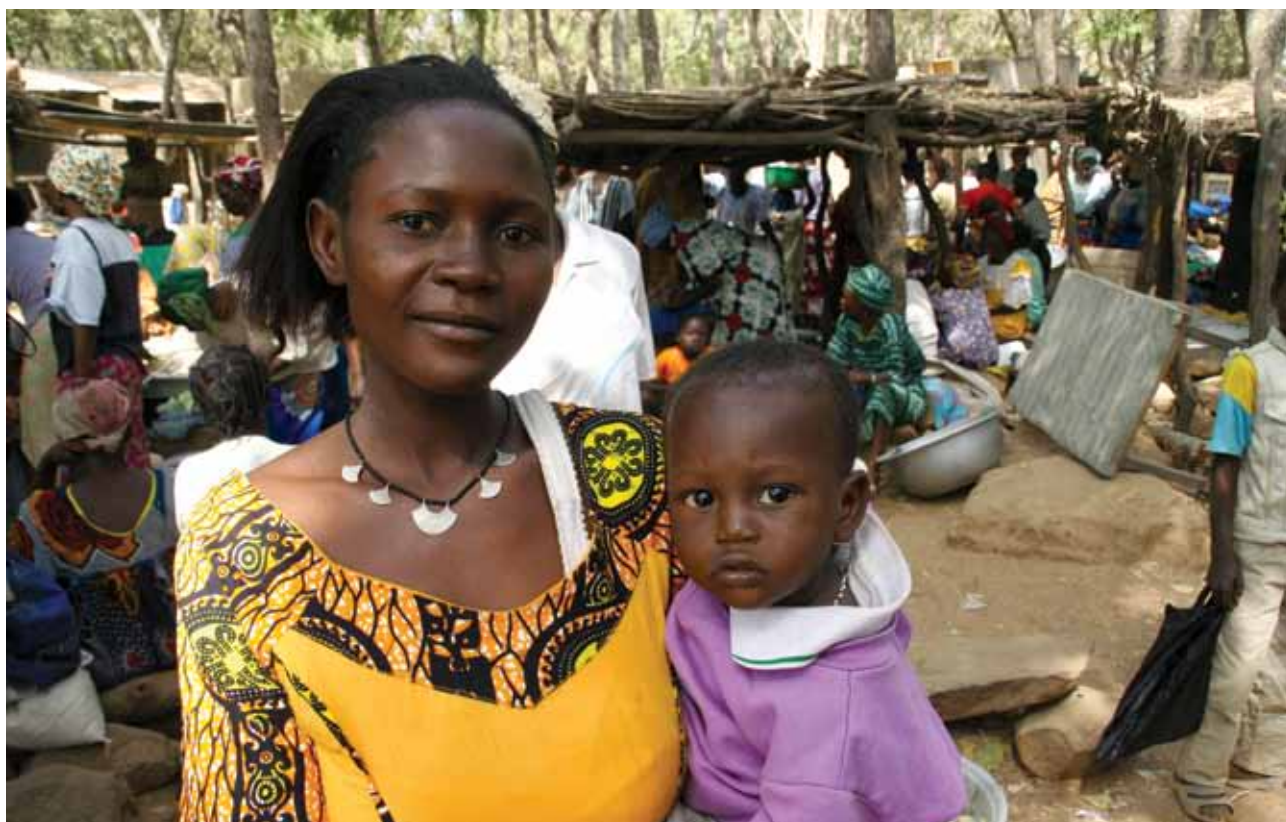
Slika 7: Zaradi uspešne razrešitve kriznih razmer lahko prebivalci Burkine Faso nemoteno opravljajo svoja vsakodnevna opravila (foto: Jurij Senegačnik).

Nekdanjo portugalsko kolonijo Angolo, ki jo naseljuje okrog 90 etničnih skupin, pretresajo nemiri in državljanske vojne že od leta 1953. Tedaj se je oblikovala protikolonialna koalicija, ki se je kasneje razdelila v dve glavni politični sili (MPLA in FNLA). Nastopila sta proti kolonialni oblasti, ki pa je oblikovala gibanje UNITA. Desetletna državljanska vojna (1961 in 1971) se je končala z avtonomijo, pet let pozneje pa z neodvisnostjo Angole. Beg portugalskih kolonistov je poslabšal gospodarsko stanje, socialistična usmerjenost Angole pa je iskala zaveznike na Kubi in v Sovjetski zvezi. Rivalstvo med strujami in delovanje tujih sil so vodile v drugo državljansko vojno. Komaj