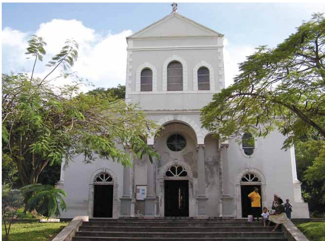
Slika 6: Katoliška vera je ena od najbolj dinamičnih verskih skupnosti v Podsaharski Afriki. Na sliki je Katoliška cerkev v Victoriji na Sejšelih.

političnih elit, oblikovanih v času ob in po osamosvojitvi. Nacionalizmi afriških nedržavnih narodov skušajo oblikovati nacionalne države ali vsaj izsiliti široke avtonomije. Zato so ponekod znotraj državnih ozemelj nastale paradržave, nekateri deli pa so se tudi dejansko osamosvojili. Prvi val spopadov se je odvijal v šestdesetih in sedemdesetih letih, drugi pa v devetdesetih letih 20. stoletja. V Maliju (med letoma 1990 in 1995) in Nigru (med letoma 1991 in 1997) je potekal upor Tuaregov na severu s separatističnimi težnjami (5). V Gani in Slonokoščeni obali je v istem obdobju potekal oster medetnični boj med pretežno muslimanskimi in pretežno krščansko-animističnimi predeli. Prava državljanska vojna se je odvijala v Nigeriji (med letoma 1967 in 1969) po razglasitvi neodvisnosti Biafre na gosto poseljenem jugu (13). V tej najbolj obljudeni afriški državi živi nad 250 etničnih skupin, ki se po veroizpovedi ločijo na: muslimane (približno 43 %, največ Hausa in Fulani), protestante (22 %), katoličane (9 %), precej