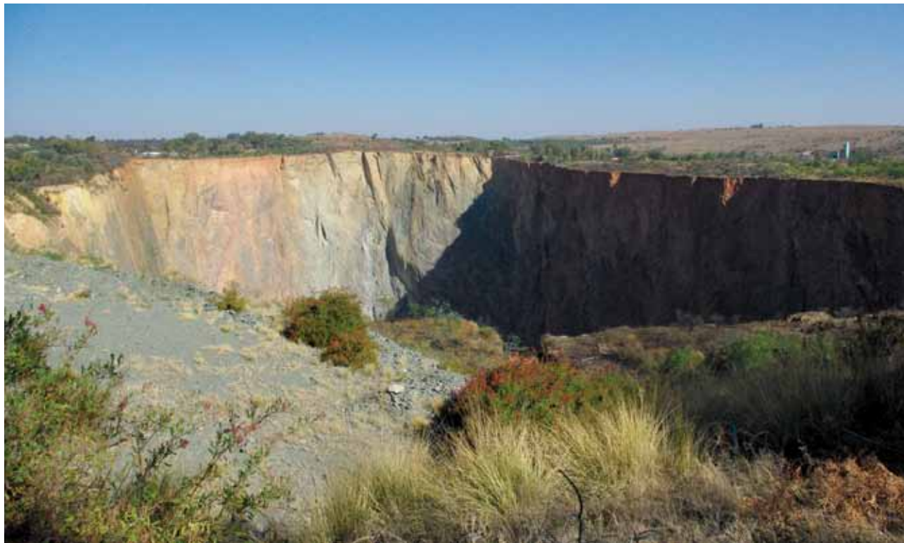
Slika 2: Afrika je pomemben izvoznik surovin, pa tudi dragocenih kamnov. Na sliki je rudnik diamantov Cullinan v Južnoafriški republiki, kjer je bil leta 1905 izkopen največji diamant na svetu (foto: Katja Vintar Mally).

Le portugalske posesti (Gvineja Bissau, Zelenortske otoki, Angola in Mozambik) so morale počakati do leta 1974 oziroma 1975. Egiptu se je uspelo izpod angleškega protektorata iztrgati leta 1922. Za osamosvajanje so bile bolj kot enotna odporiška gibanja (z izjemo severne oziroma t. i. arabske Afrike) zaslužne razmere znotraj kolonialnih sil. Njihove temelje sta zamajala zlasti dva procesa: začasni poraz med drugo svetovno vojno, še bolj pa rast domače intelektualne elite (15). Bistven je bil tudi ideološki vpliv, občasno povezan z izdatno gospodarsko in vojaško pomočjo komunističnih držav, predvsem Sovjetske zveze in njenih satelitov (10).