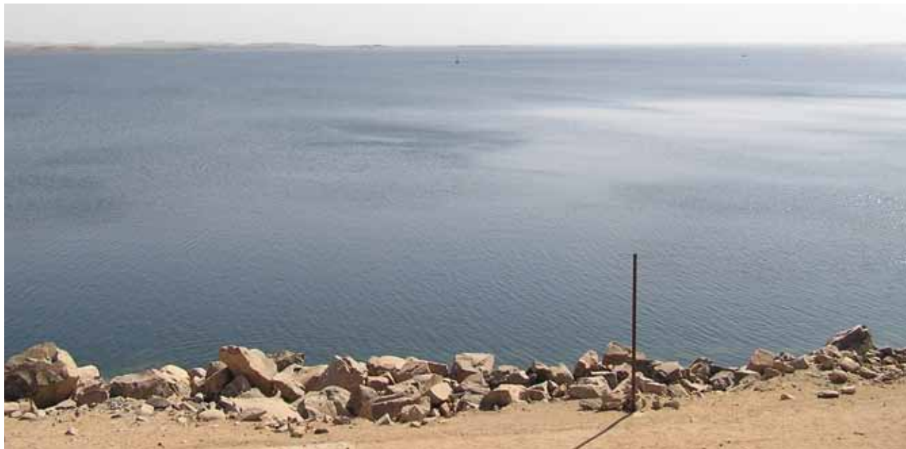
Slika 5: Naserjevo jezero v Egiptu je velik vodni rezervoar, ki je nastal za Asuanskim jezom na reki Nil, enem največjih razvojnih projektov v Afriki.

Arabske države so v zadnjih desetletjih doživele korenite družbene spremembe. Nagla rast števila prebivalstva, večanje gostote prebivalstva v mestih, spreminjanje tradicionalne kmečko-obrtniške družbe v industrijsko in storitveno ter večji stik ljudi z zahodno civilizacijo je v domače okvire vztrajno vnašala nove vrednote, ki so se izrazili v valu nezadovoljstva, nemirov, prevratov in celo državljskih vojn. Na arabsko družbo so te spremembe vplivale močnejše, kot se pogosto predvideva. Število izobražencev se je močno povečalo in ponudba delovnih mest jim ni utegnila slediti. Mnogi (ne le izobraženi) so iskali svoje priložnosti na začasnem delu v Evropi, predvsem v državah severno-sredozemskega loka (Španija, Francija, Italija), pa tudi v Srednji in Zahodni Evropi. Iz teh območij prihaja tudi glavna turistov, kar je imelo dolgoročne ekonomske, kulturne in politične učinke (5). Prav tako ne gre zamenjati različnih oblik poslovnega sodelovanja, zlasti v Tuniziji in Egiptu. Po drugi strani so postajale arabske družbe vse bolj gospodarsko ranljive. Ob povečanem številu prebivalstva se je državna usmeritev na uradništvo, naftno industrijo, kmetijstvo in turizem soočala z brezposelnostjo vse bolj izobražene mladine. Naftna industrija je državam še vedno dajala sorazmerno visoke donose, korist pa je imela predvsem gospodarska in politična elita. V teh so hitro prepoznali krivca za svoj brezizhodni socialni položaj in jih v valu protestov odstranili z oblasti. V Libiji