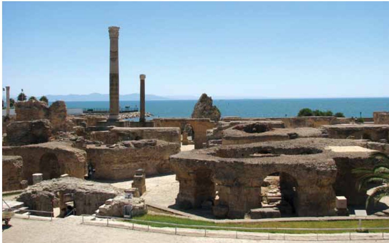
Slika 1: Ostanke starodavne Kartagine.

Politični zemljevid Afrike je mlad. Večina držav je dosegla osamosvojitve v sedanjih državnih okvirih šele po drugi svetovni vojni, in sicer v obdobju med letoma 1951 in 1975. Samostojnost so prve dosegle severnoafriške države (sredi petdesetih let 20. stoletja), ki so se v valu uporov organizirano uprle francoski, angleški in španski oblasti. Veliki val osamosvojitve je sledil leta 1960 in v naslednjih letih. To kratko obdobje so zgodovinarji pozneje imenovali "rojstvo Afrike".