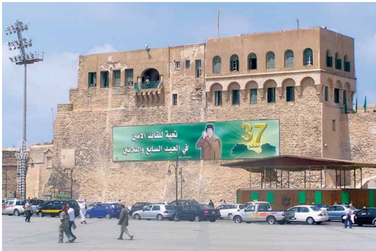
Slika 4: Polkovnik Moamer el Gadafi je bil dolgoletna osrednja ikona Libije. Ob praznovanju obletnice prevrata leta 2007 je našel svoje mesto tudi na obzidju Rdeče utrdbe (narodnega muzeja) v Tripoliju.

Severnoafriške arabske države se po politični tradiciji in gospodarski strukturi precej razlikujejo. Države Magreba (arabsko: zahod; Maroko, Tunizija in Alžirija) imajo poleg Berberov in Tuaregov tudi Arabce. Te države so dedinje arabske islamizacije in poznejših samostojnih državnih tvorb, ki so šele proti koncu 19. stoletja prišle pod francosko oziroma špansko (del Maroka) posest. Predvsem v priobalnem in atlaškem delu Tunizije ter Alžirije so doživeli tudi intenzivno francosko kolonizacijo. Francosko prebivalstvo se je po osvobodilni vojni (1954–1962) večinoma umaknilo. Od vseh magrebskih držav je imela najboljše odnose z evropskimi državami kraljevina Maroko, medtem ko je bila Alžirija, verjetno tudi zaradi zgodovinskega spora z vplivno evropsko silo Francijo, veliko bolj previdna. Tunizija je bila ves čas odprta do Evrope in zato privlačna za evropske turiste.